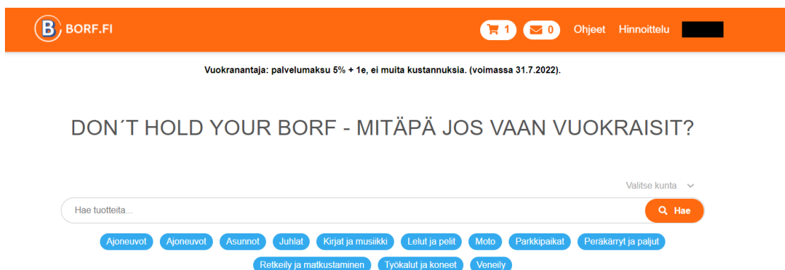
Kuva 1. Etusivun näkymä kirjautuneelle käyttäjälle.

Kannattavan liiketoiminnan kehittämiseksi päätimme Bid or Rent Finlandissa lähteä luomaan oman alustan, jotta voimme tarjota palvelut edullisemmin kuin tällä hetkellä markkinoilla toimivat muut vuokranvälitysalustat. Muut toiminnassa olevat alustat hyödyntävät pääasiassa valmiita alustoja, jotka ottavat omat komissionsa ja joiden toiminnallisuuksien kehittäminen on riippuvainen käytössä olevasta alustasta (Shopify, ShareTribe,...) Borf.fi –alustaa on myös jatkossa mahdollista kehittää haluttuun suuntaan ilman huolta käytettävän alustan rakenteesta ja sen rajoituksista.