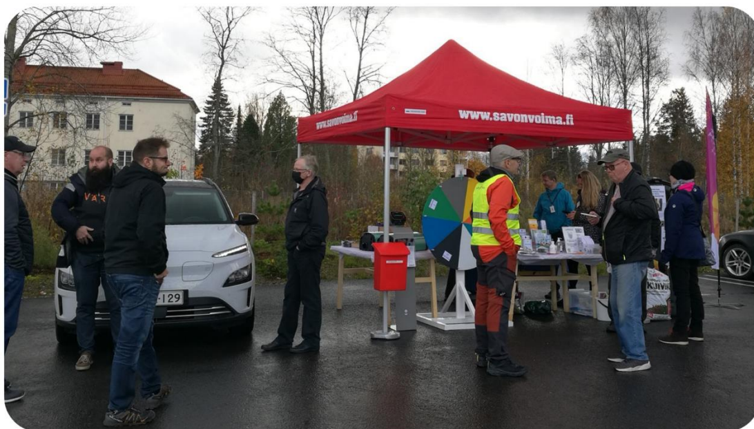
Kuva 9. Vuoden 2021 energiasäästö tapahtuma Varkaudessa

Vuonna 2021 energiasäästöviikon tapahtuma järjestettiin ulkotapahtumana Prisman pihassa Varkaudessa ja Citymarketin pihassa Iisalmissa. Tapahtumissa tarjottiin tietoa kuntalaisille muun muassa energiaremontteihin ja uusituvan energian hankintaan saatavista tuista, oman sähkönkulutuksen seurannasta ja säästämisestä asumiskulussa. Lisäksi tarjolla oli ajankohtaista tietoa sähköautoilusta ja saatavilla olevista latausratkaisuista. Mukana oli myös kuntien ilmastotyö ja marttatoiminta Kestävä arki -teemalla. Varkauden tapahtumassa oli mukana myös KotiKomposti-kampanja jakamassa tietoa kotikompostoinnista ja sen hyödyistä.