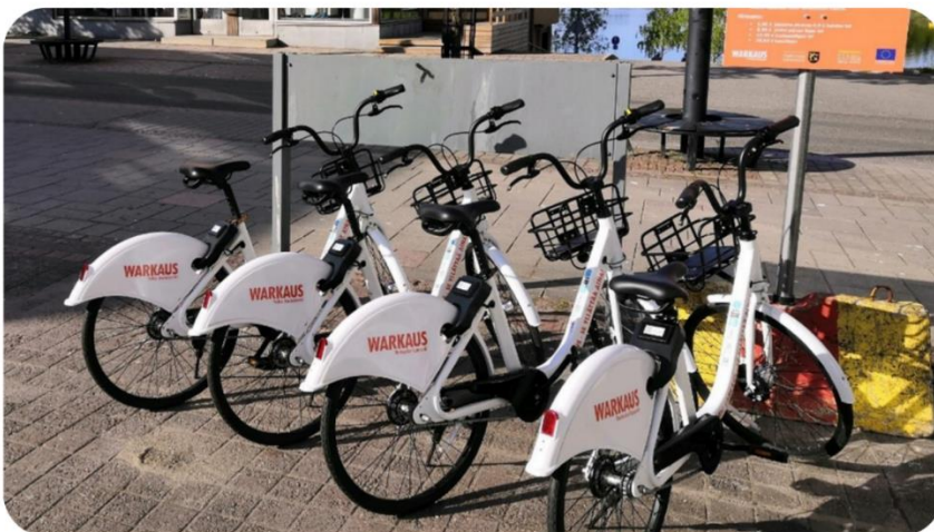
Kuva 11. Varkauden kaupunkipyörät kesällä 2021

KESTO-hanketiimi jätti kaupunkipyöräjärjestelmistä tarjouspyynnöt eri toimittajille. Pohjana oli kahdenkymmenen kaupunkipyörän järjestelmä kesäksi 2021. Varkauden kaupunki valitsi vertailun ja Navitas Yrityspalveluiden esityksen pohjalta kaupunkipyöräjärjestelmän toimittajaksi Juro Sharing Infra Oy:n. Kaupunkipyöräjärjestelmä tuli käyttöön toukokuun lopussa 2021. Pyörille perustettiin viisi pyöräparkkia, joista pyöriä voi vuokrata ja joihin ne tulee käytön jälkeen palauttaa.