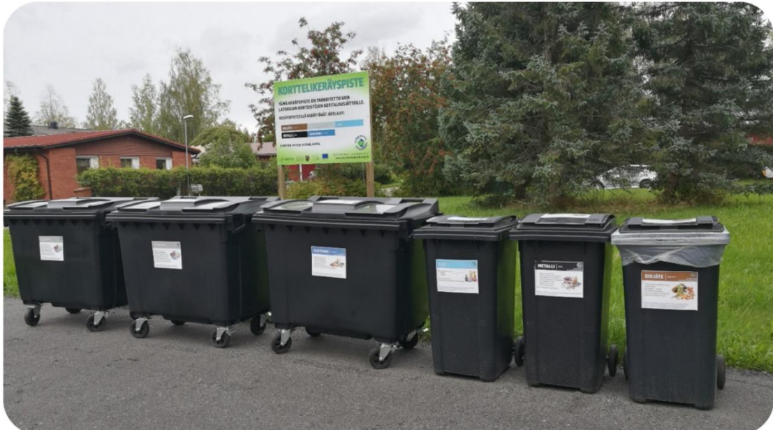
Kuva 5. Korttelikeräyspiste Varkaudessa Latokujalla

Vuoden mittainen kokeilu käynnistettiin Latokujalla 1.9.2021. Aloituksen yhteydessä Keski-Savon Jätehuolto järjesti asukkaille aloituskyselyn, jossa kartoitettiin muun muassa asukkaiden lajittelutottumuksia ja syntyvän jätteen määrää.