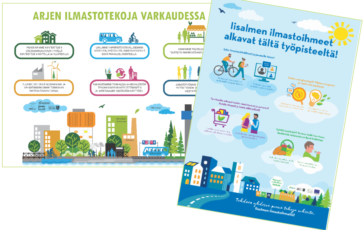
Kuva 7. Varkauden ja Iisalmen ilmastotekojen huoneentaulut.