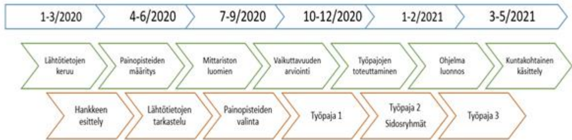
Kuva 1. Ilmasto-ohjelmien laatimisen rakenne Keski-Savossa

Kaikki Keski-Savon kunnat sekä Siilinjärvi hyväksyivät seudullisen ja kunnallisen ilmasto-ohjelman touko-kesäkuussa 2021. Ilmasto-ohjelmien hyväksymisen jälkeen siirryttiin tarkentamaan toimenpiteitä ja mittarointia.