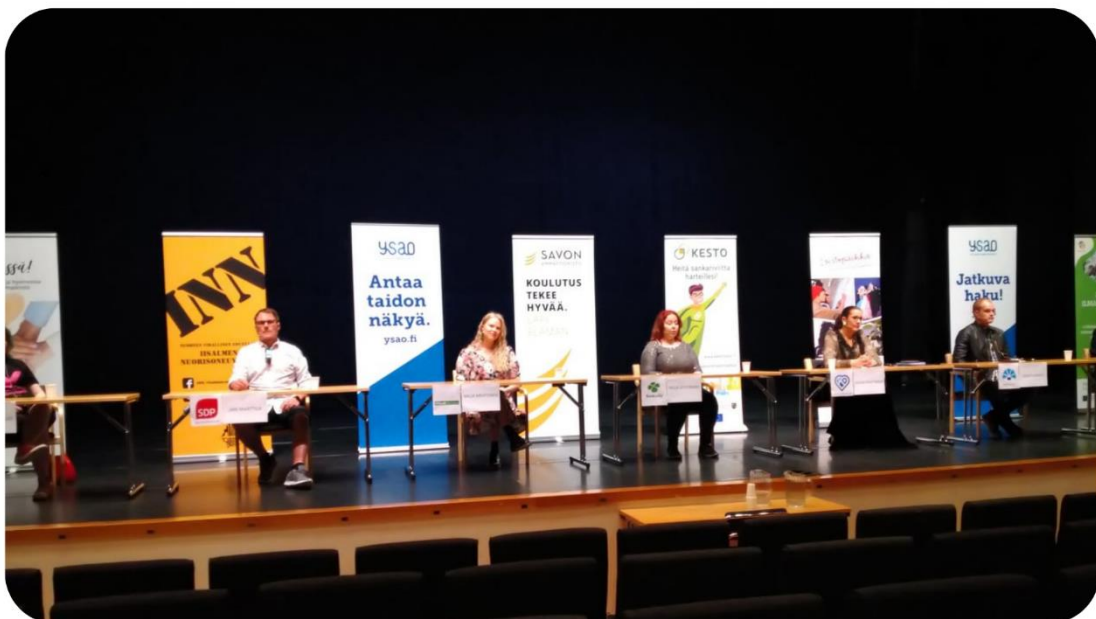
Kuva 10. Nuorten ilmastovaalipaneelin panelistit.

Pieniä Ilmastotekoja -hanke, KESTO-hanke, Iisalmen lyseo, Ylä-Savon ammattiopisto, Savon ammattiopisto ja Iisalmen nuorisoneuvosto järjestivät keväällä 2021 nuorisovetoisen ilmastopaneelin, jossa nuoret pääsivät haastamaan tulevia kuntapäätäjiä nuorille tärkeissä ilmastokysymyksissä. Nuorilta kysyttiin kysymyksiä ennakoon ja niistä valittiin sopivimmat esitettäväksi panelisteille. Panelisteiksi saatiin mukaan edustajat seitsemästä eri puolueesta. Paneeli striimattiin ja sitä katsoi yhteensä sen julkaisuaikana yli 80 henkilöä.