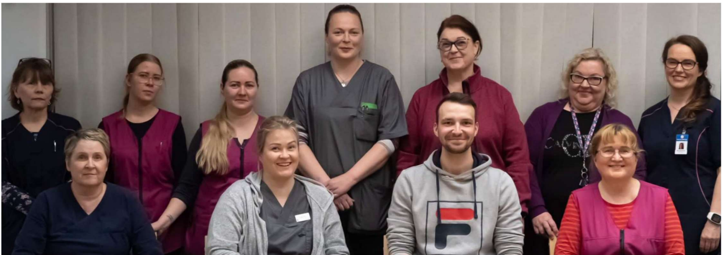
Kuvassa Verenpisara tiimi

Tutustu palveluihimme ja ota yhteyttä! www.kotipalveluverenpisara.fi