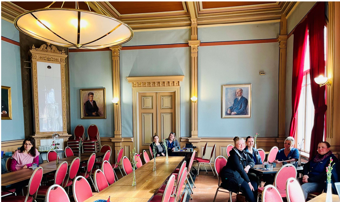
Kuva Iisalmen Kanta-kiihdyttämö kirjaus livestä Raatihuoneelta 12.5.2022.